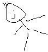
Figura 2: Los guionistas siempre tienen historias que contar

Aunque hay diferentes formas de estructurar un guión cinematográfico, la estructura en tres actos es la más extendida y usada en el mundo del cine. Es fácil de seguir, simple, y nos permite entender a los personajes y sus acciones. El libro de Syd Field, El manual del Guionista , es muy buena base para aprender a escribir siguiendo esta estructura y lo recomiendo a todos aquellos interesados en seguir estudiando este tema (mira la Figura 2).