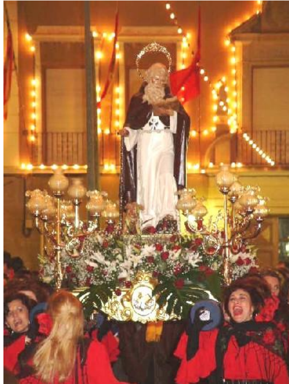
Figura 2: Fotos San Antonio Abad