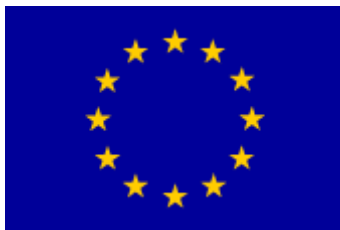
Figura 1 : Bandera de la Unión Europea