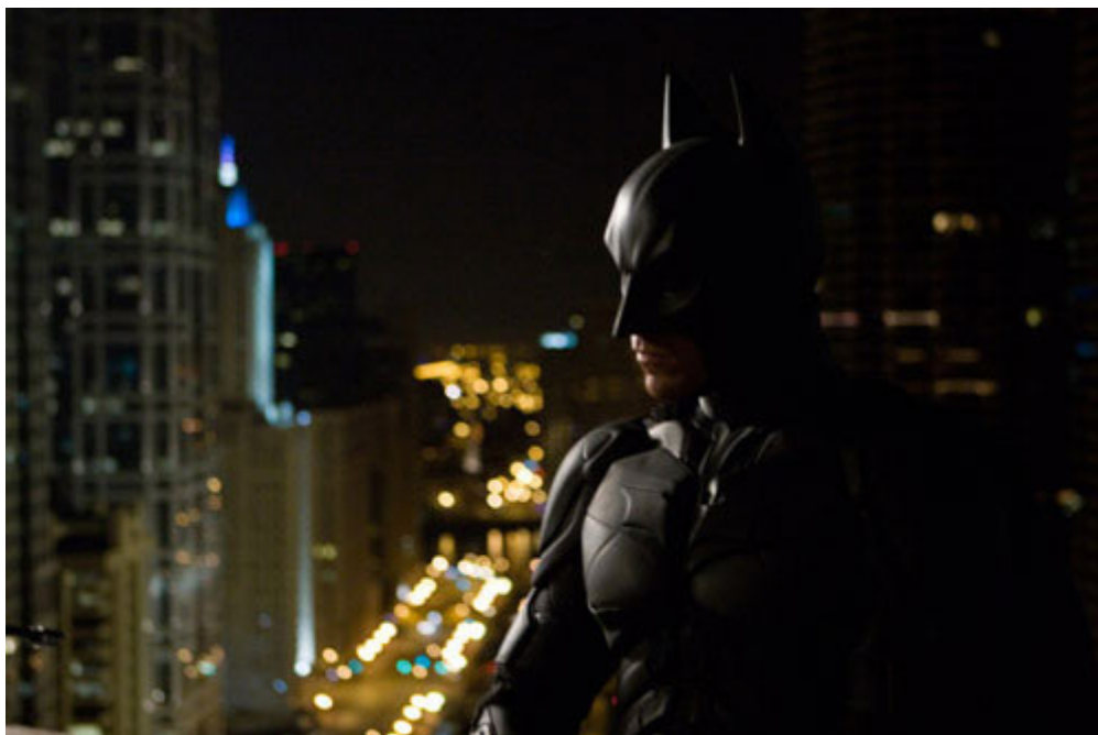
Foto de The Dark Knight extraída de http://www.lashorasperdidas.com